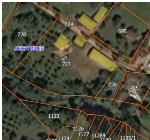
Извод из ГеоСрбије

Катастарска парцела број 727 КО Декутинце за коју се издају локацијски услови налази се у селу Декутинце, Општина Владичин Хан које представља примарно сеоско насеље. Предметна парцела је у директој вези са кп.бр. 724 КО Декутинце која представља некатегорисани пут изграђен пре доношења прописа те испуњава услов за грађевинску парцелу. Објекат који је предмет реконструкције и доградње је изграђен пре доношења прописа.