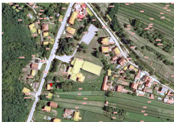
Извод из ГеоСрбије

Катастарска парцела број 1930 КО Стубал за коју се издају локацијски услови налази се у селу Стубал, Општина Владичин Хан које представља субопштински центар са развијеним секундарним и терцијарним сектором. На парцели постоји објекат грађен пре доношења прописа – земљиште под зградом у површини од 49 м 2 који се у једном малом делу задржава, док се остатак уклања (113 м 2 ) и дограђује у складу са идејним решењем. Предметна парцела има приступ преко кп.бр. 3566/2 КО Стубал која представља пут изграђен пре доношења прописа у јавној својини Општине Владичин Хан.