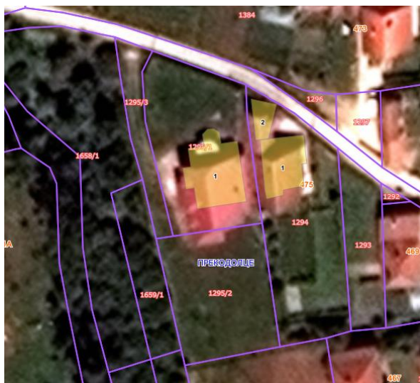
Извод из ГеоСрбије

Катастарска парцела број 1295/2 КО Прекодолце за коју се издају локацијски услови налази се у селу Прекодолце, Општина Владичин Хан које представља субопштински центар са развијеним секундарним и терцијарним сектором. Предметна парцела излази на кп.бр. 3735/1 КО Владичин Хан која је у вези са кп.бр. 3732 КО Прекодолце-Просторним планом намењена за општински пут.