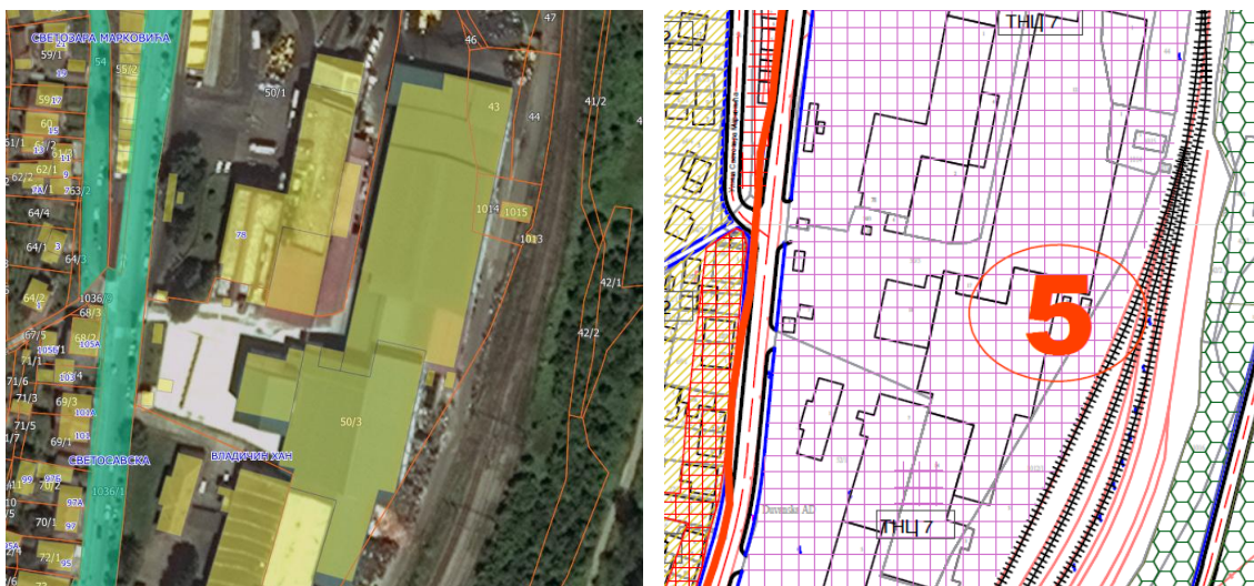
ГеоСрбија / Извод (графички прилог) из Плана генералне регулације насеља Владичин Хан и Измене и допуне планских докумената (Сл. Гласник Града Врања, 6/2019)

Правила грађења се утврђују на основу Плана генералне регулације насеља Владичин Хан („Сл. гласник Пчињског округа број 25/2007), Измена и допуна плана генералне регулације за насеље Владичин Хан („Сл. гласник Града Врања број 7/2014) и Измена и допуна планских докумената (Сл. Гласник Града Врања, 6/2019), по коме се предметна парцела налази у зони 5 – Нектар и породично становање, у оквиру дела ТНЦ 7 - парцеле производних комплекса.