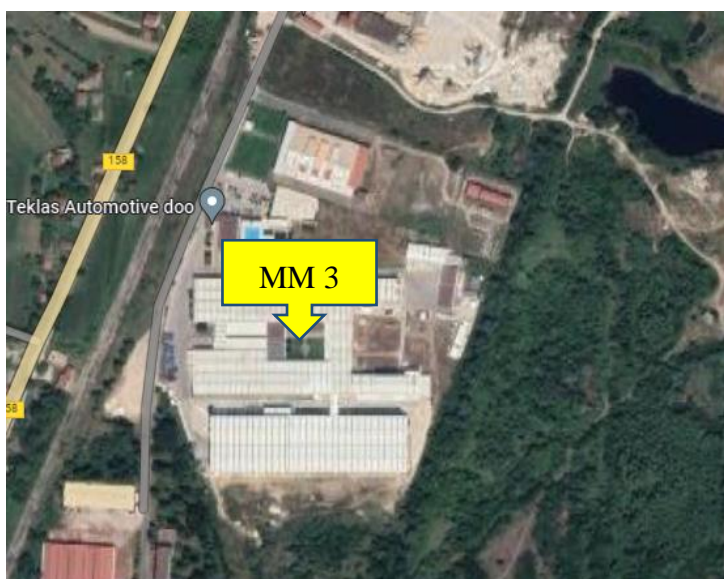
Slika 3. Mikrolokacija MM 3