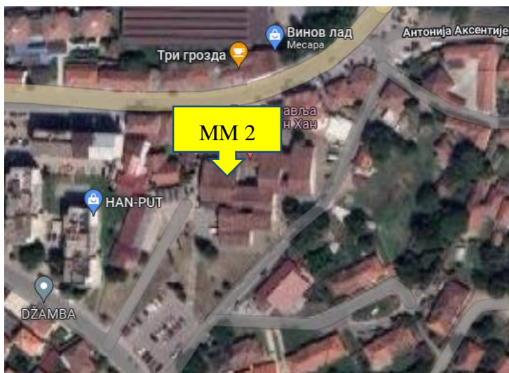
Slika 2. Mikrolokacija MM 2